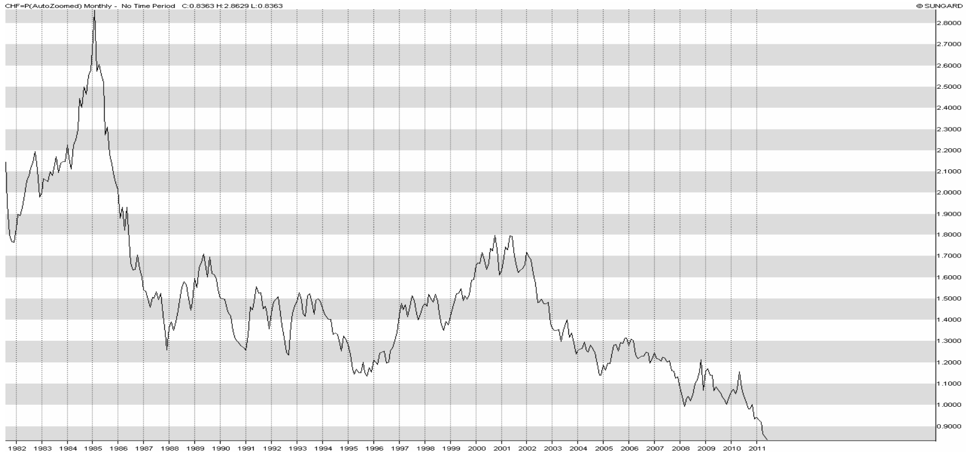
Chart USD/CHF auf Monatsbasis und als Liniendiagramm – ist es nicht vielmehr eine Dollarkrise?

Oder schauen wir uns einmal die Relation US-Dollar zum Schweizerfranken an. Es steht sogar im Blick, und wenn es im Blick steht, was ist dann ????