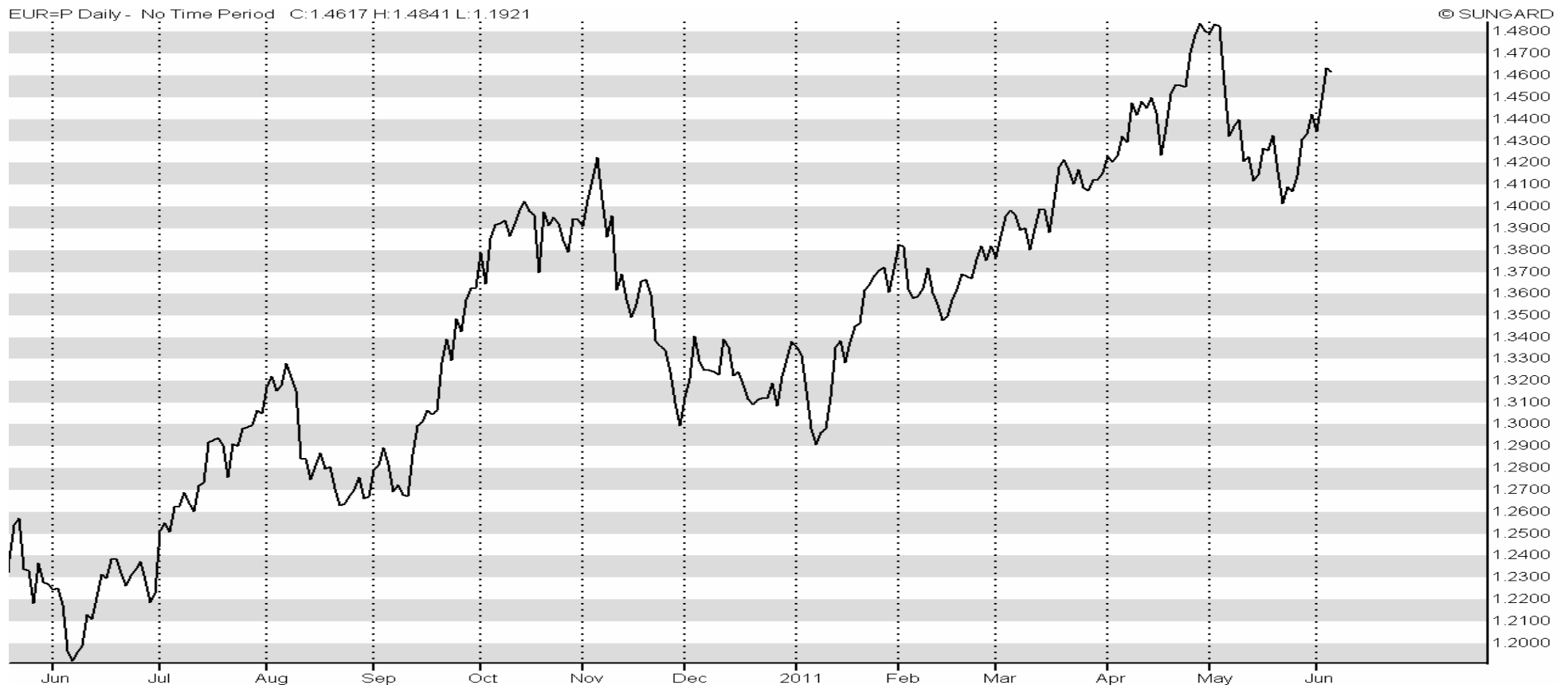
Chart EUR/USD auf Tagesbasis und als Liniendiagramm – wir sehen einen steigenden Euro zum US-Dollar, wer spricht dann also von einer Eurokrise?

Aktuelles Beispiel: Problematik Eurokrise. Haben wir eine Eurokrise? Ja oder Nein?